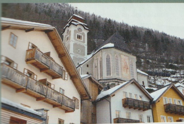
Het kleine kerkje past in Hallstatt nog net tussen de Anton Pieck huisjes