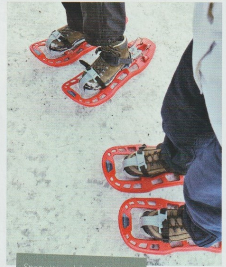
Sneeuwwandelen in Abtenau.