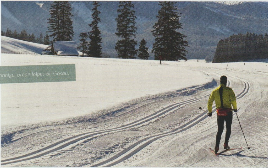
Zonnige, brede loipes bij Gosau.