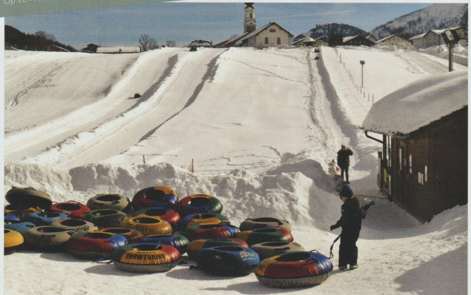
Op een rubber band naar beneden roetsjen in Faistenau.

doen aan een bord 'kaiserschmarren', een voedzaam streekgerecht dat veel weg heeft van een mislukte omelet met poedersuiker en kersenjam. Het ligt als een blok in je maag, en je hoeft de eerste uren niet meer te eten. Maar lekker!